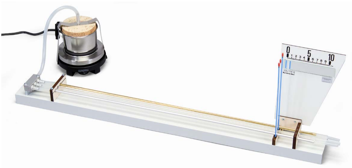
Fig. 1 Experimenteller Aufbau

berechnen, wobei l der Länge der Rohre vom Festlager bis zur Auflage auf der Rollachse entspricht.