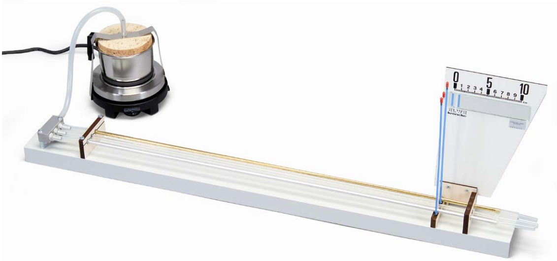
Fig. 1 Montaje experimental

siendo l la longitud del tubo de prueba hasta el eje giratorio.