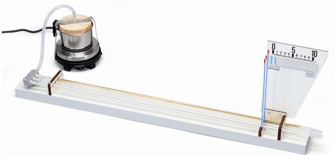
Fig. 1 Montagem da experiência

sendo que l é o comprimento dos tubos desde a sua fixação até o apoio no eixo de rolamento.