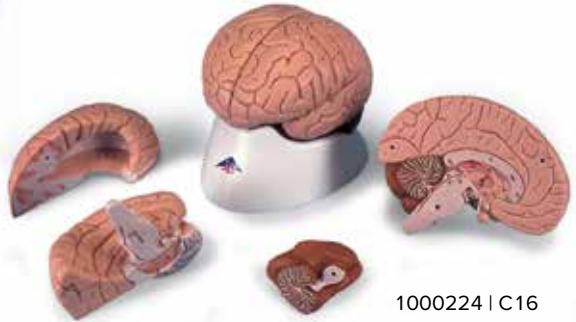
1000224 | C16