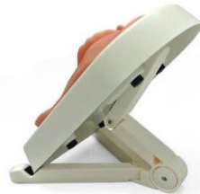
图 4：放入底座中并放在支架上的会阴切开训练模型