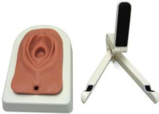
图 3：放入底座中的会阴切开训练模型，带支架