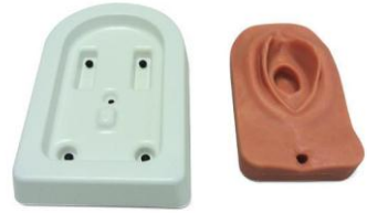
图 1：会阴切开训练模型和底座