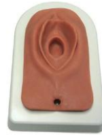
图 2：放入底座中的会阴切开术训练模型