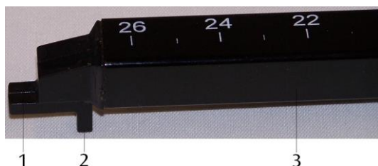
Sonda de campo magnético: 1 Sonda de Hall tangencial (Dirección z), 2 Sonda de Hall axial (Dirección x), 3 Soporte