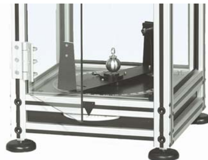
Fig. 3 Fuente luminosa para la proyección de la sombra, pantalla de observación y disco angular del péndulo de Foucault