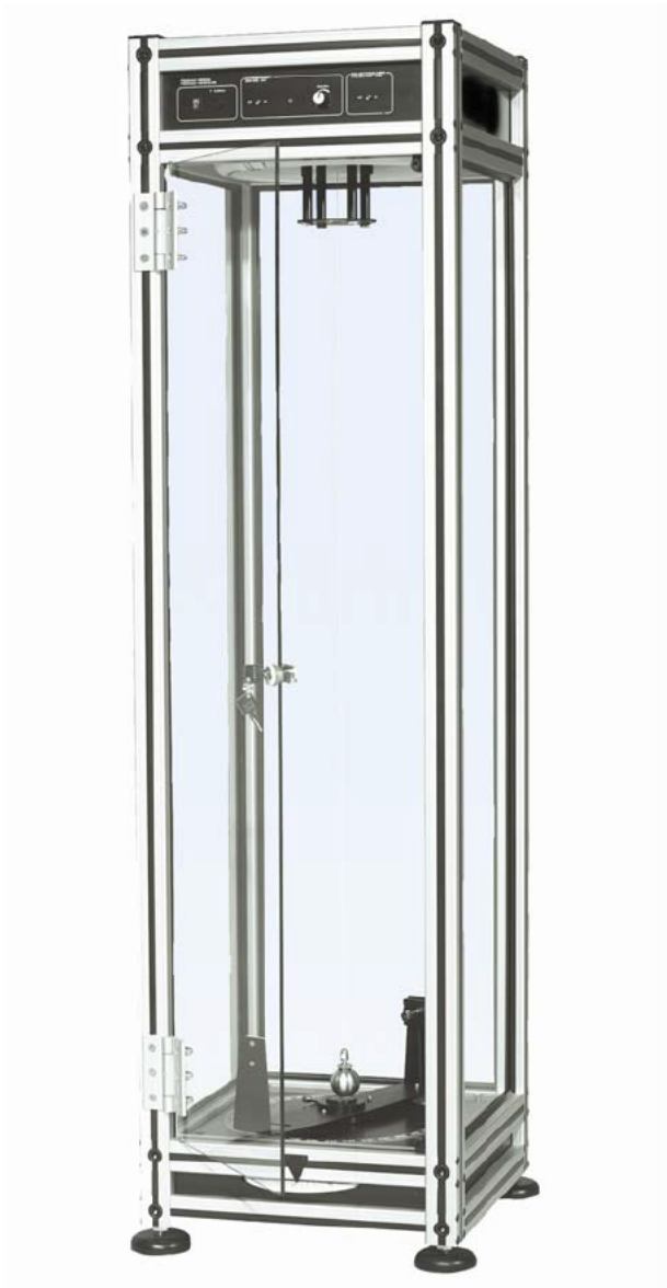
Fig. 1 Péndulo de Foucault