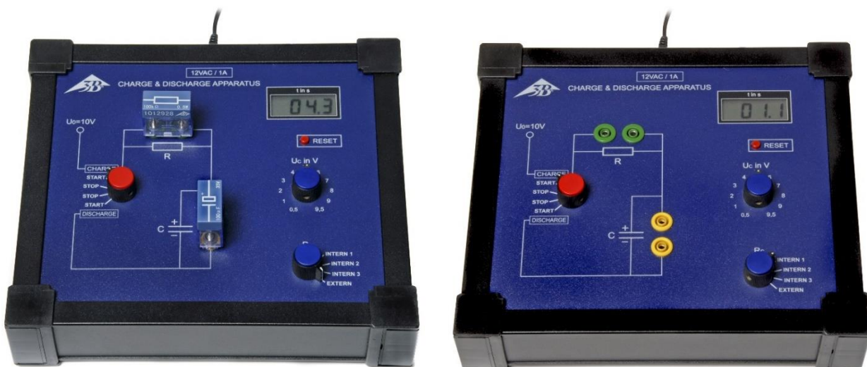
Fig. 1: Equipo de carga y descarga en funcionamiento con combinación de resistencia y condensador externo (izquierda) e interno (derecha)